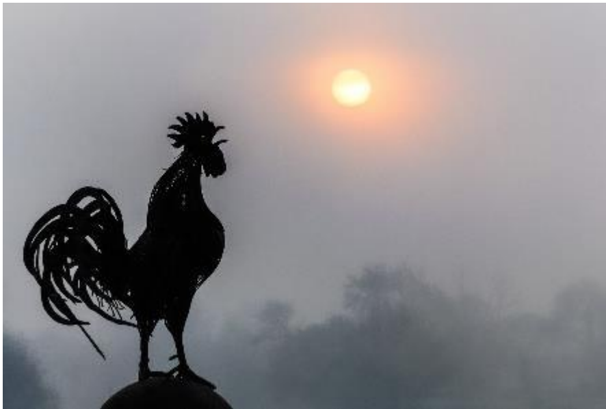
Yves DEGRUSON 2 ème