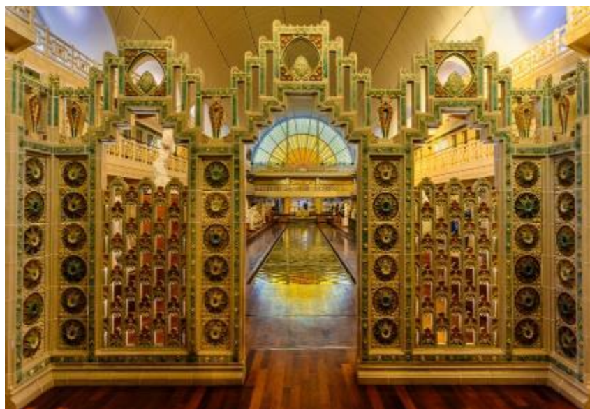
Yves DEGRUSON 1 er ex aequo