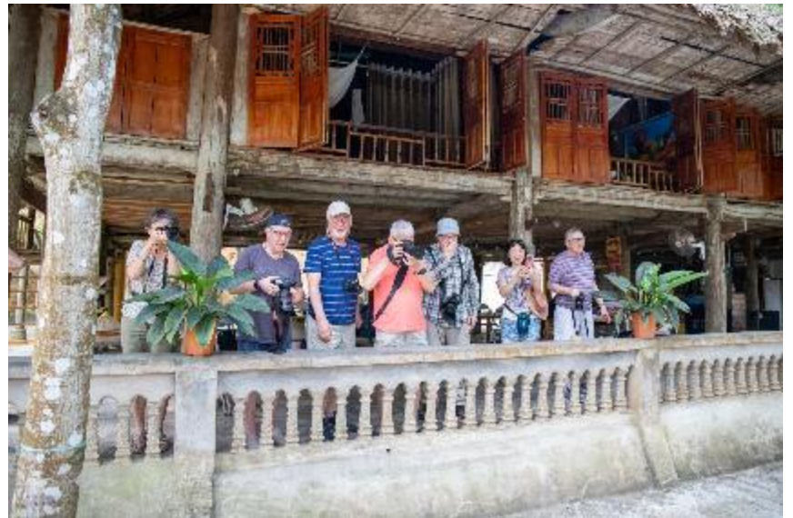
Chez Monsieur BA