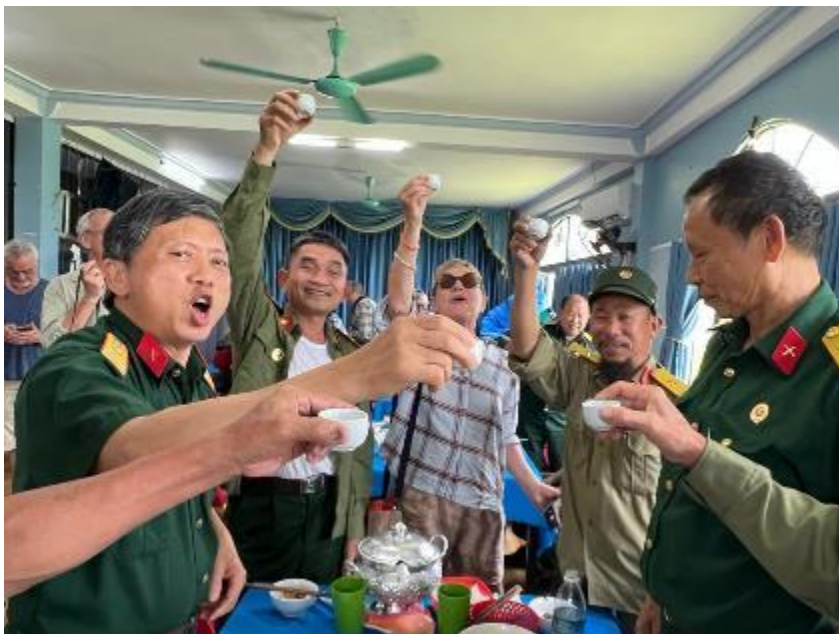
Scène de fraternisation avec des anciens combattants