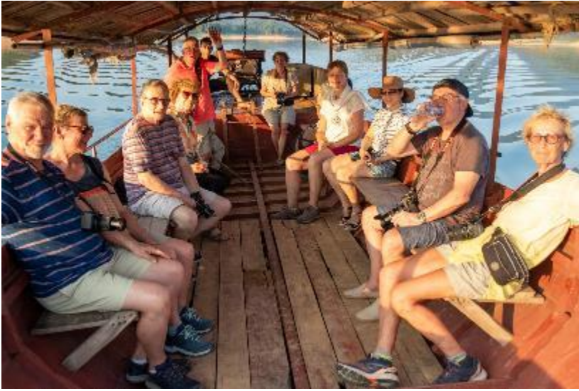
Sur le lac Thac Ba