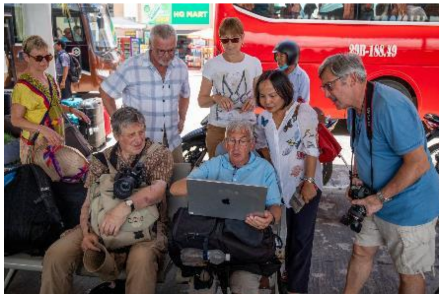
Des élèves attentifs !