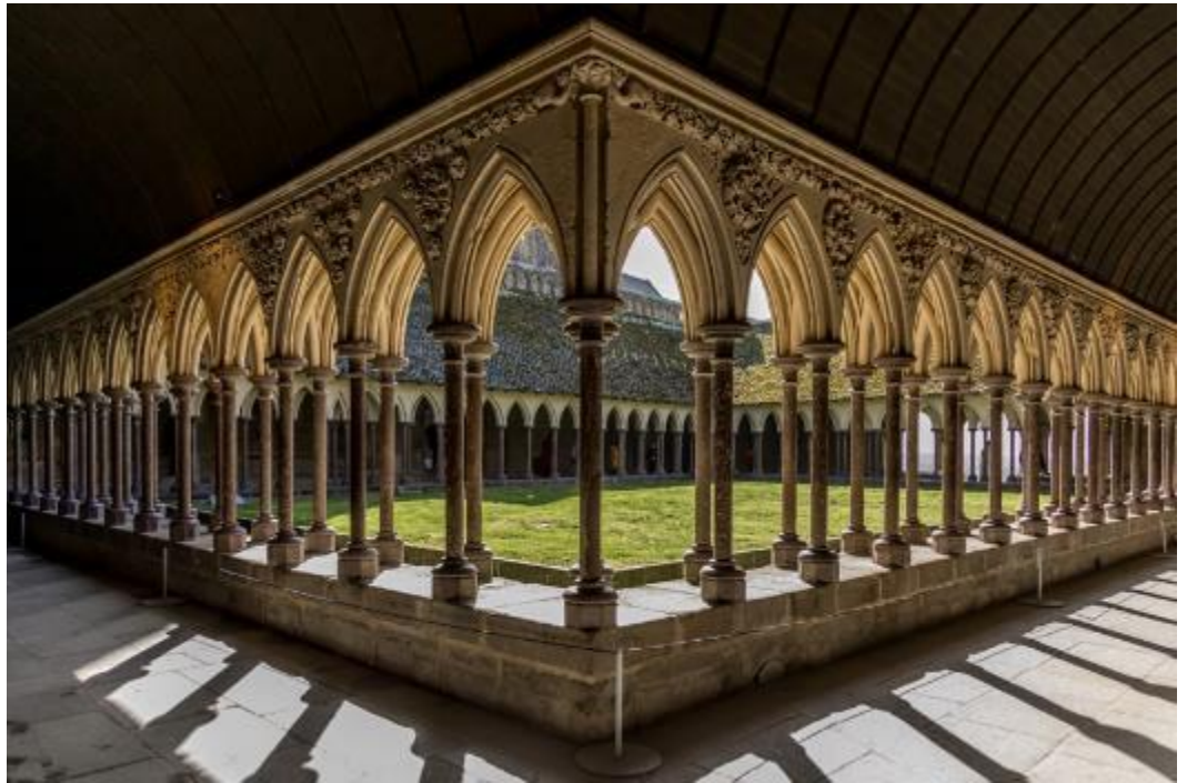
Michel DUMONT 1 er ex aequo